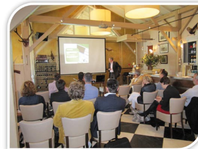
Bijeenkomst User Group 4 Retail 19 mei j.l. in De Rotonde te Enspijk.

De User Group 4 Industry zal na de zomer plaats vinden.